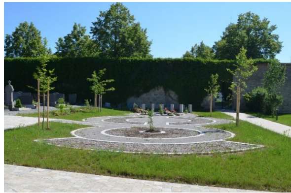
neuer Urnenbereich am Friedhof