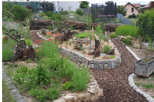
im Heuweg: Spielplatz für die Natur