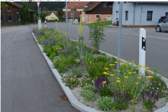
Verkehrinsel bei der Schule