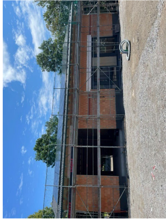
Neubau Feuerwehrhaus Kirchenrohrbach