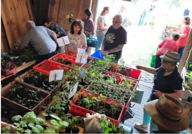
Im reichlichen Sortiment an Gemüsepflanzen, Sommerblumen und Stauden wurden viele Besucher der OGV-Pflanzenbörse in Walderbach fündig

Zahlreich haben sich am Maifeiertag Gartenfreunde aus Walderbach und Umgebung auf dem Vereinsgelände des Obst- und Gartenbauvereins eingefunden. Bei ihrer schon traditionellen Pflanzenbörse stellten die Walderbacher Gartler wieder ein reichhaltiges Sortiment an Staudenablégern, Kräutern, Tomatenjungpflanzen, Gemüsesetzlingen sowie Sommerblumen, Zwiebelpflanzen und Sträuchern auf Spendenbasis bereit. Zimmerpflanzen, Naturdünger aus Schafwolle und ein Flohmarktstand ergänzten das Angebot. Im Innenraum des OGV-Häuschens wartete eine schöne Auswahl selbstgebastelter Gartenartikel – Vogelhäuser, Insektenhotels, Bienenwachstücher, Marmelade, Vogeltränken und verschiedene Dekorationen. Daneben fand sich ein vielfältiges Kuchen- und Tortenbuffet für die Kaffeetrinker. Für Freunde herzhafter Kost gab es „grüne Brotzeit“ mit Bärlauch-, Schnittlauch- und Radieserlbrot. Bei bestem Frühlingswetter blieben viele Besucher nach dem Stöbern im Pflanzensortiment zur Kaffeepause im beschatteten Bereich hinterm Haus. Auch für die Kinder war etwas geboten: Der „lebende Maibaum“, eine stattliche Süßkirsche am Vereinsgelände, wurde mit Holzscheibchen dekoriert, die die Kinder bemalen durften. Zum Mitnehmen gab es für die Kids kleine Stofftäschchen, die sie nach eigenen Vorstellungen gestalten konnten. Wie im Flug verging der bunte Nachmittag, an dessen Ende beinahe alle verfügbaren Pflanzen neue Besitzer gefunden hatten.