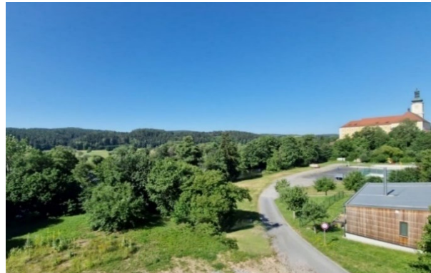
der Blick von der Tagespflegestelle