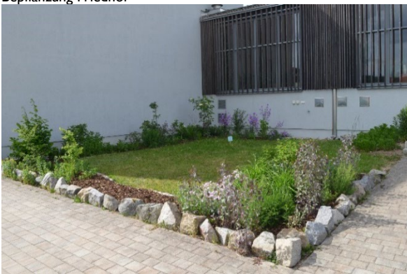
Fledermausgarten an der Schule