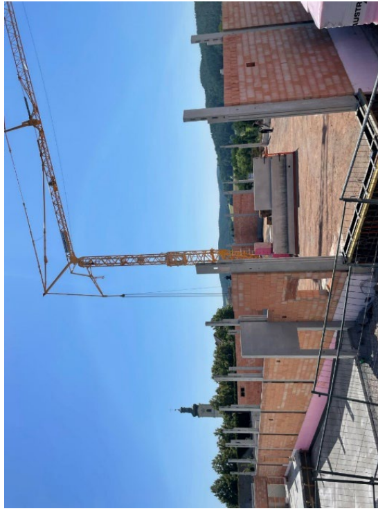
Neubau Edeka in Walderbach